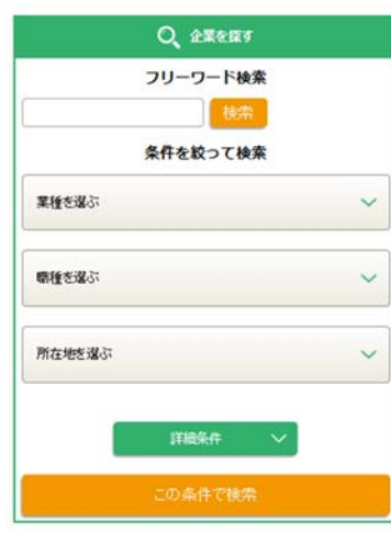
スマートフォン用画面

「投資育成キャリアナビ」は、ネームバリューのある大手企業に学生が集まる売り手市場のなか、採用意欲のある投資先中小企業の声を受けて開設しました。